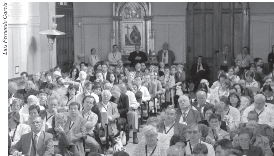
La trobada va tenir lloc a la Universitat Abat Oliba.